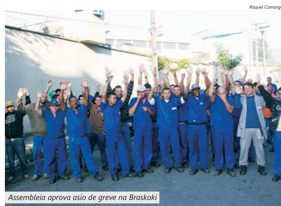
Assembleia aprova asio de greve na Braskoki

Companheiros em duas empresas na base aprovaram ontem em assembleia avisos de greve por melhores propostas de PLR.